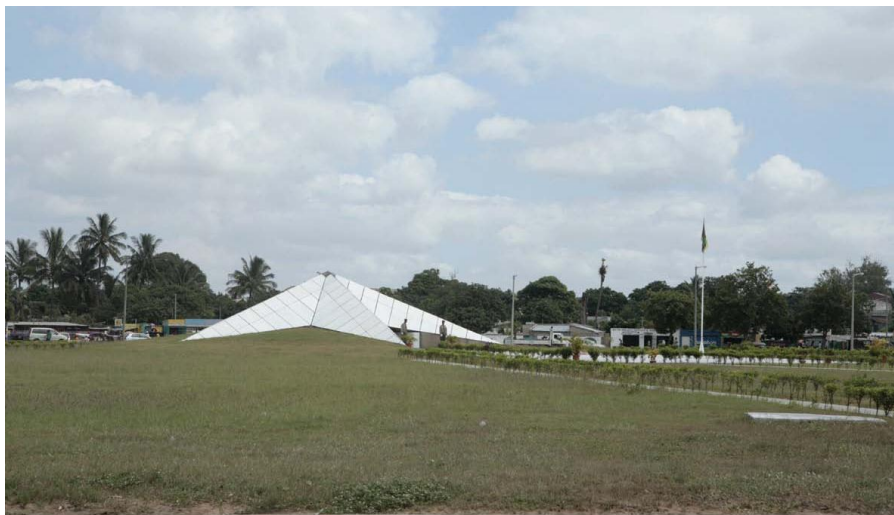
莫桑比克英雄广场

莫桑比克是多民族、多部族国家，全国约有60多个部族。主要部族有马库埃—洛姆埃族（GRUPO MACUA-LOMUE，约占总人口的40%）、绍纳（CHONA）—卡兰加族（CARANGA）、尚加纳族、佐加族（TSONGA）、马拉维—尼扬加族（MALAVI-NYANJA）、马孔德族（MAKONDE）和尧族（YAO）等。