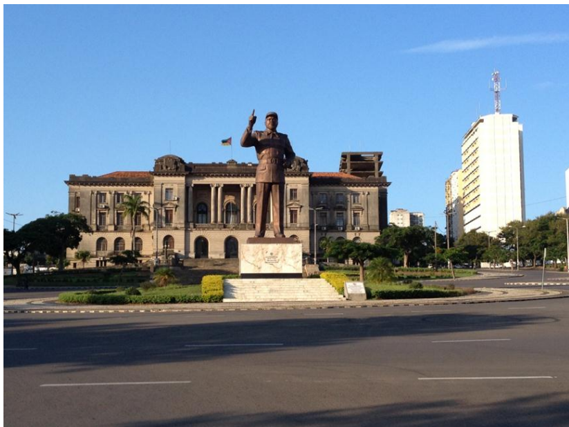
市政厅和莫首任总统萨莫拉雕像

1974年9月7日，莫桑比克解放阵线（简称“解阵党”）同葡萄牙政府签署了关于莫桑比克独立的《卢萨卡协议》。9月20日成立以解阵党为主体的过渡政府。1975年6月25日正式宣告独立，成立莫桑比克人民共和国，萨莫拉为首任总统。1990年11月，议会决定将国名改为莫桑比克共和国。独立后，莫桑比克全国抵抗运动党（简称“抵运党”）长期进行反政府武装活动。1992年10月4日，莫政府和抵运党在罗马签署和平总协议，从而结束了长达16年的内战。